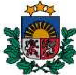
Dabas aizsardzības pārvalde