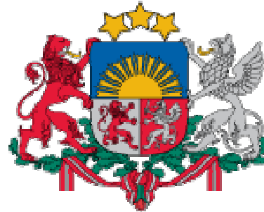
Vides aizsardzības un reģionālās attīstības ministrija